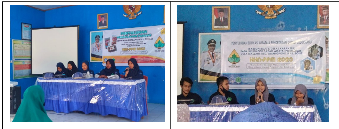
Gambar 2 Penyuluhan pengolahan pangan, offset sederhana dan edukasi wisata