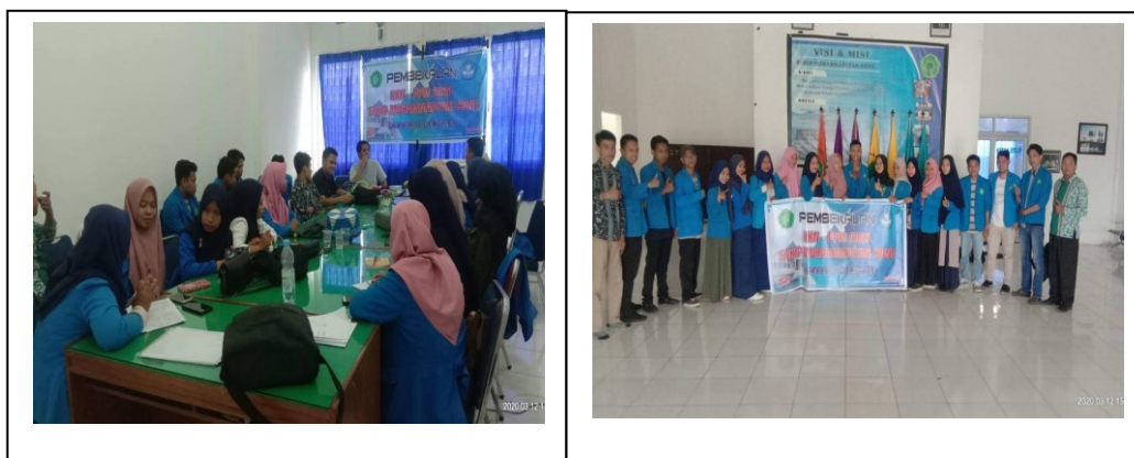
Gambar 1 Proses Pembekalan KKN-PPM

Materi umum kegiatan pembekalan berkaitan dengan pelaksanaan KKN PPM secara umum. Materi tersebut diantaranya 1) Filosofi KKN-PPM (Kuliah Kerja Nyata Pembelajaran Pemberdayaan Masyarakat) bertujuan agar Mahasiswa mampu menanamkan nilai-nilai nasionalisme, kepribadian, keuletan, etos kerja, tanggung jawab, kemandirian, kepemimpinan, kewirausahaan, dan penanaman jiwa kepengabdian pdada masyarakat. 2) Berpikir Kreatif dan Inovatif dalam memecahkan persoalan di masyarakat bertujuan agar mahasiswa mampu berpikir kreatif dan inovatif dalam memecahkan persoalan di masyarakat. 3) Etika Pergaulan di masyarakat bertujuan agar mahasiswa mampu mengetahui etika dalam melakukan pergaulan pada masyarakat, 4) Penyusunan program kerja, laporan dan Penilaian KKN-PM, diharapkan mahasiswa mampu membuat dan menyusun program kerja dan laporan KKN-PPM