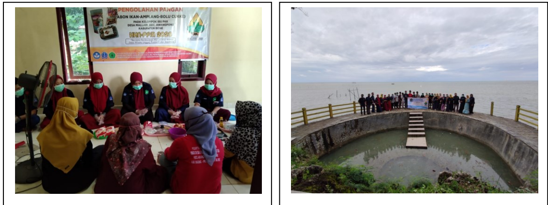
Gambar 3 Pelaksanaan pelathan pengolahan Pangan dan Edukasi Wisata